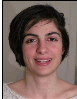
Μα- Τσί- ετών

Αποφοίτησα από το Τμήμα Κοινωνικής Ανθρωπολογίας και Ιστορίας το 2007. Σημαντικότερη εμπειρία ήταν σίγουρα η ανεξαρτησία και η αληθινή ενηλικίωση που προσφέρουν οι σπουδές μακριά από τον τόπο καταγωγής και την οικογένειά σου. Το συγκεκριμένο αντικείμενο σπουδών ήταν επιλογή μου και βρήκα πολύ ενδιαφέροντα τα μαθήματά του τμήματος. Είναι αλήθεια ότι προς το τέλος των σπουδών μου θα ήθελα μαθήματα που να αφορούν σε πιο σύγχρονα ζητήματα.